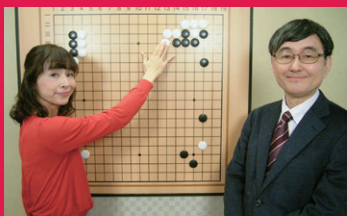
写真：石倉 昇九段(右)、吉原由香里六段(左)