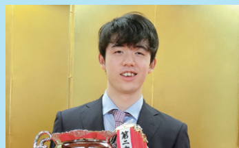
写真：藤井聡太銀河