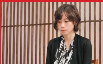
写真: 謝 依旻七段