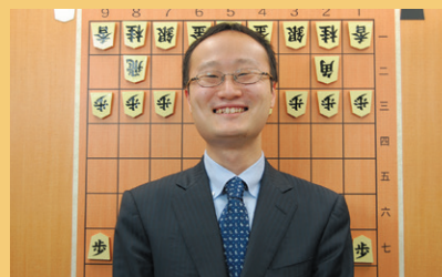
写真: 渡辺 明名人