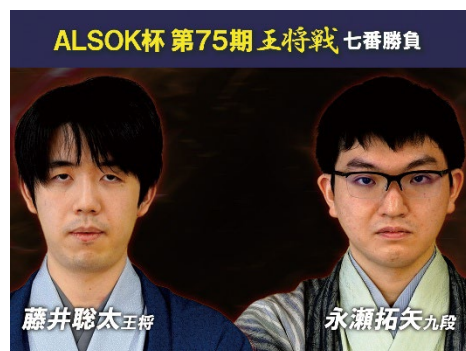
藤井聡太王将(左)、永瀬拓矢九段(右)

2 月は藤井聡太王将 vs 永瀬拓矢九段の七番勝負が佳境を迎える。永瀬九段は、昨年は 3 度にわたり藤井王将との二日制七番勝負を戦ったが、いずれも 3 連敗スタート。4 局目以降では五分の勝負を演じたものの、出だしの遅れが響きどのシリーズも接戦に持ち込めなかった。永瀬九段自身は今回の王将戦開幕を前に「藤井王将との番勝負を通じて随分鍛えられたし、棋力も上がってきた感覚がある」と語る。今回はどのような戦いを見せるか。